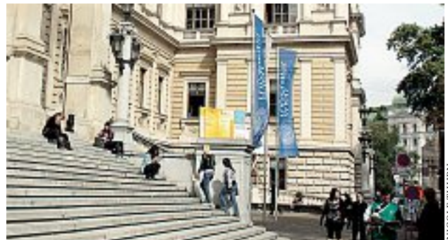
Ganz hinten: Die Uni Wien ist gerade noch unter den Top 200

Eines scheint klar: Das Potenzial der älteren Bevölkerung wird nicht wahrgenommen: Weder von Unternehmen, noch der Politik und oft nicht einmal von den Betroffenen selbst.